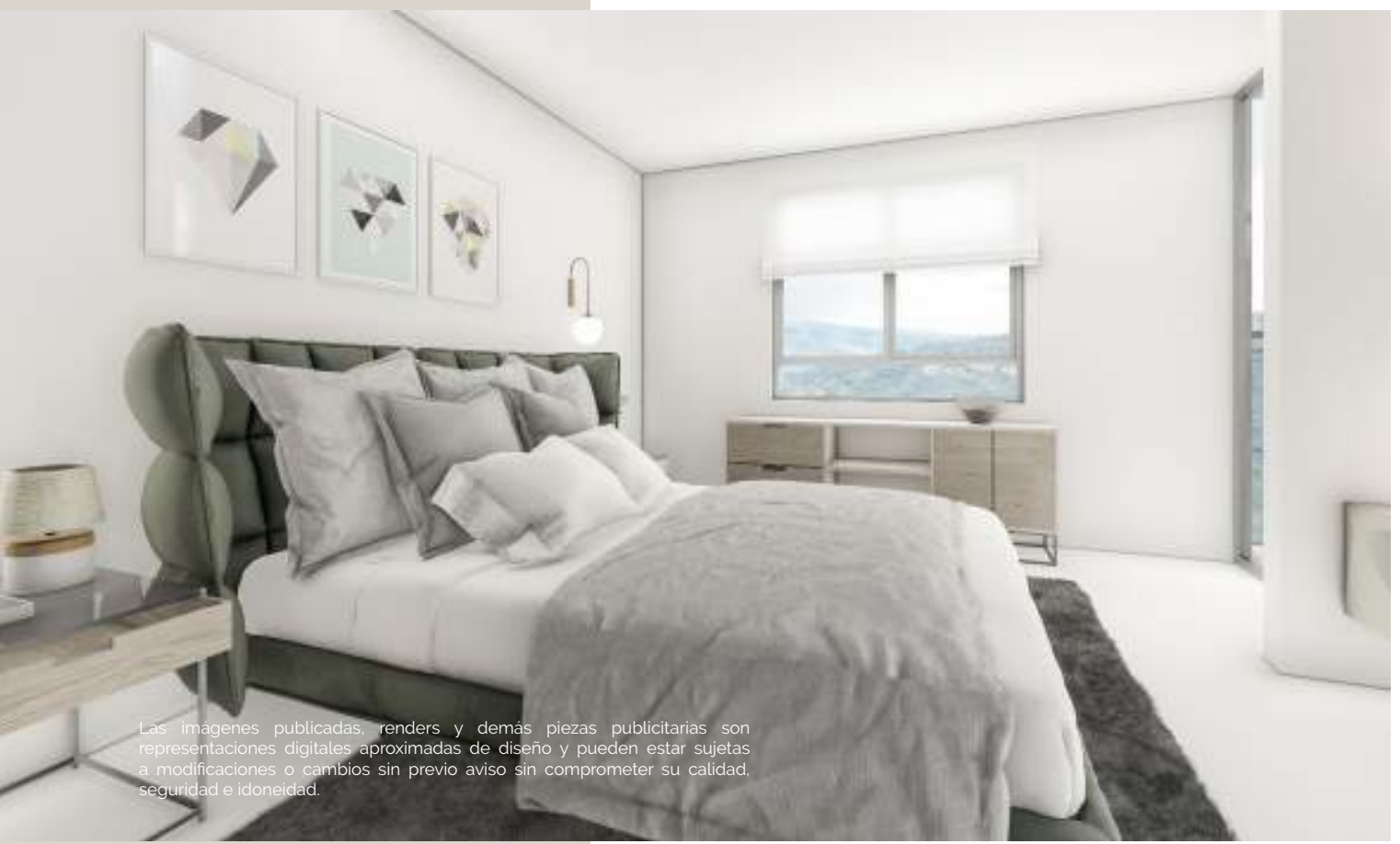
PH-D. Alcoba ppal. ▼

Las imágenes publicadas, renders y demás piezas publicitarias son representaciones digitales aproximadas de diseño y pueden estar sujetas a modificaciones o cambios sin previo aviso sin comprometer su calidad, seguridad e idoneidad.