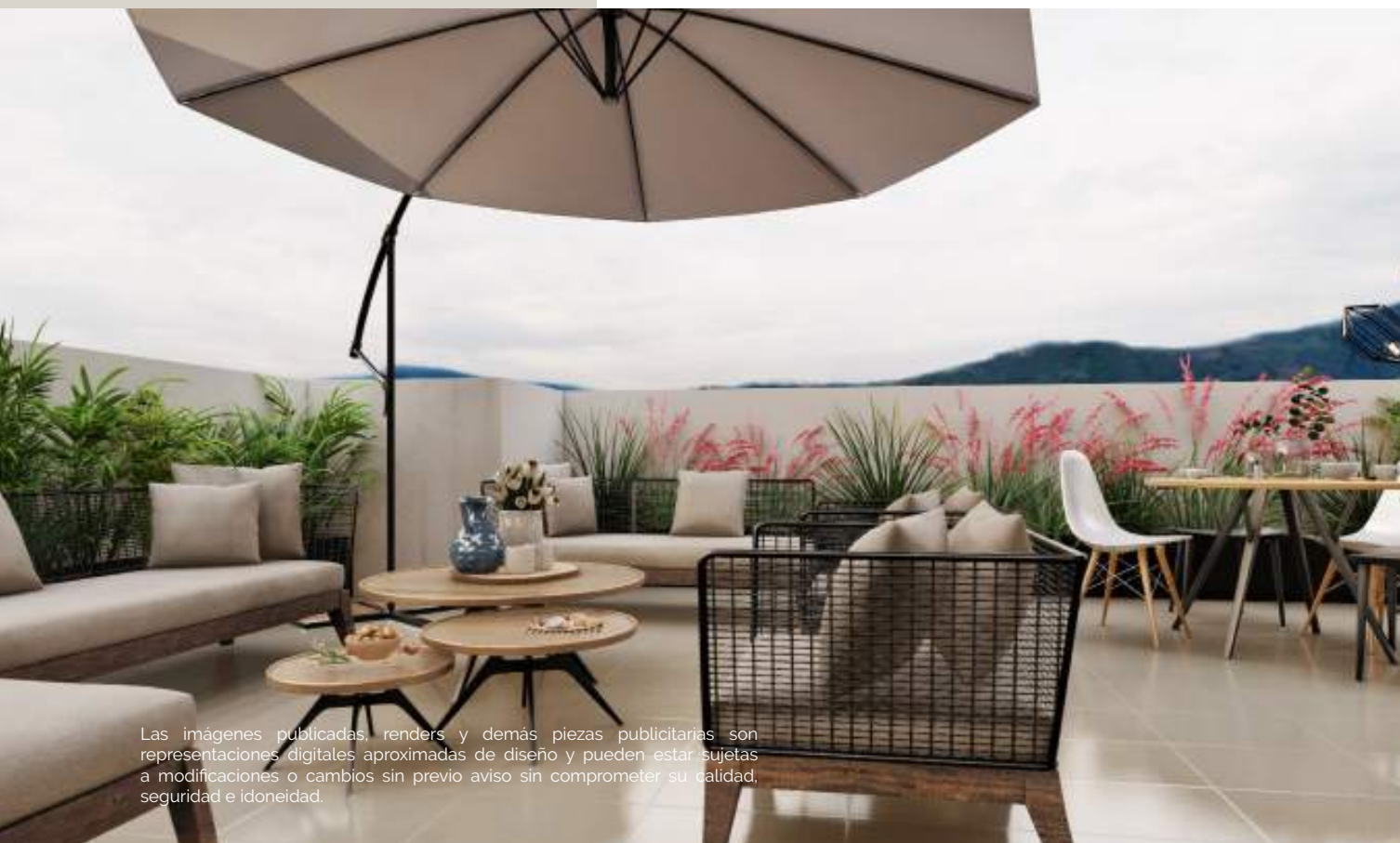
PH-F. Terraza ▼

Las imágenes publicadas, renders y demás piezas publicitarias son representaciones digitales aproximadas de diseño y pueden estar sujetas a modificaciones o cambios sin previo aviso sin comprometer su calidad, seguridad e idoneidad.